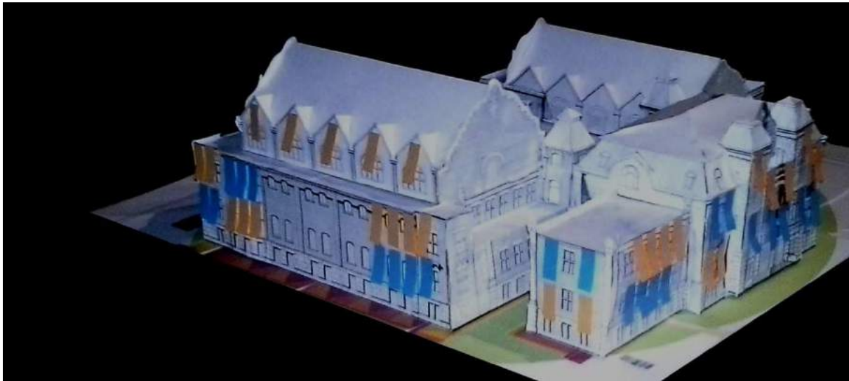
Modell des Museums der Deutschen Binnenschifffahrt, mit beflaggter Fassade im Maßstab 1:100